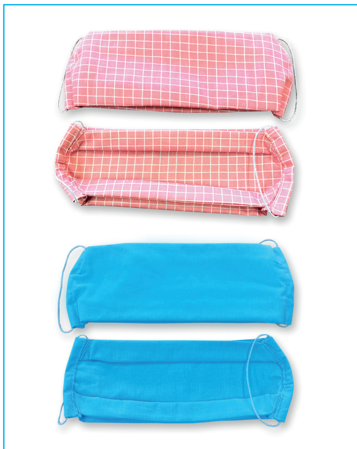
Модель «Прямоугольная со складками»